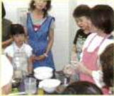
話を聞く子供の目も真剣!

「はじめて甘酒を飲みました。果物とのコラボでとてもおいしかった!」「簡単でおいしいスイーツ、家でも作ります!」など評判も上々!