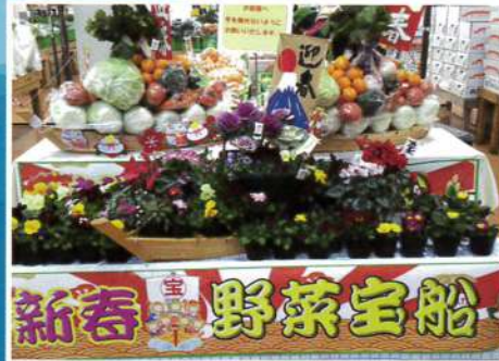
お花の宝船も登場!