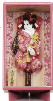
振袖ちりめん 赤 × ちりめん ピンク