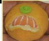
どうです! この出来映え!!

「みかんの皮をむくのが上手にできて良かった!」「また参加したい!子供も喜んでできました!」「親子でとても楽しめました♡」などなどイケメン!? 講師の手際の良さもあり参加者全員大満足!