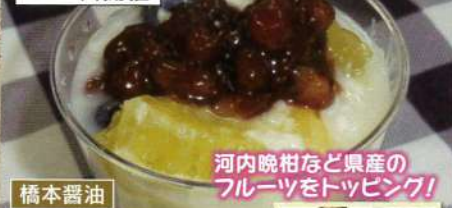
河内晩柑など県産の フルーツをトッピング!