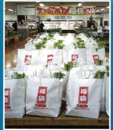
野菜、果物それぞれあわせて 100袋限定の福袋