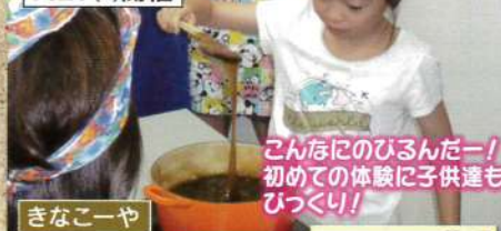
みんなのひろんだー! 初めての体験に子供達も びっくり!