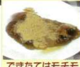
できたてはモチモチ感があり美味!

「できたてのやわらかさが分かった」「はじめてだったがとても楽しかったです!」など全員が初めて参加したリクエストに応えての本わらび餅づくり体験は大成功!