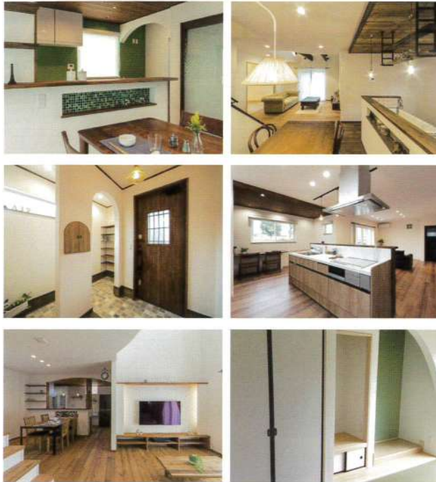
※写真は全てイメージです