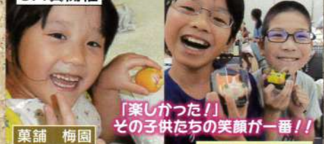
「楽しかった!」 その子供たちの笑顔が一番!!