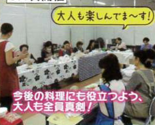
大人も楽しんでます!

「初めて作った!わかりやすく楽しかったです!」「しょうがはこれからどんどん食べます!」「バリエーションが増えて嬉しいです!」など今後の料理にも役立つ講習会でした。