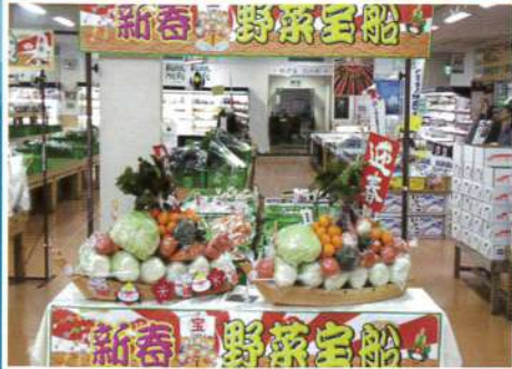
8品目31点の野菜、果物がてんこ盛り!